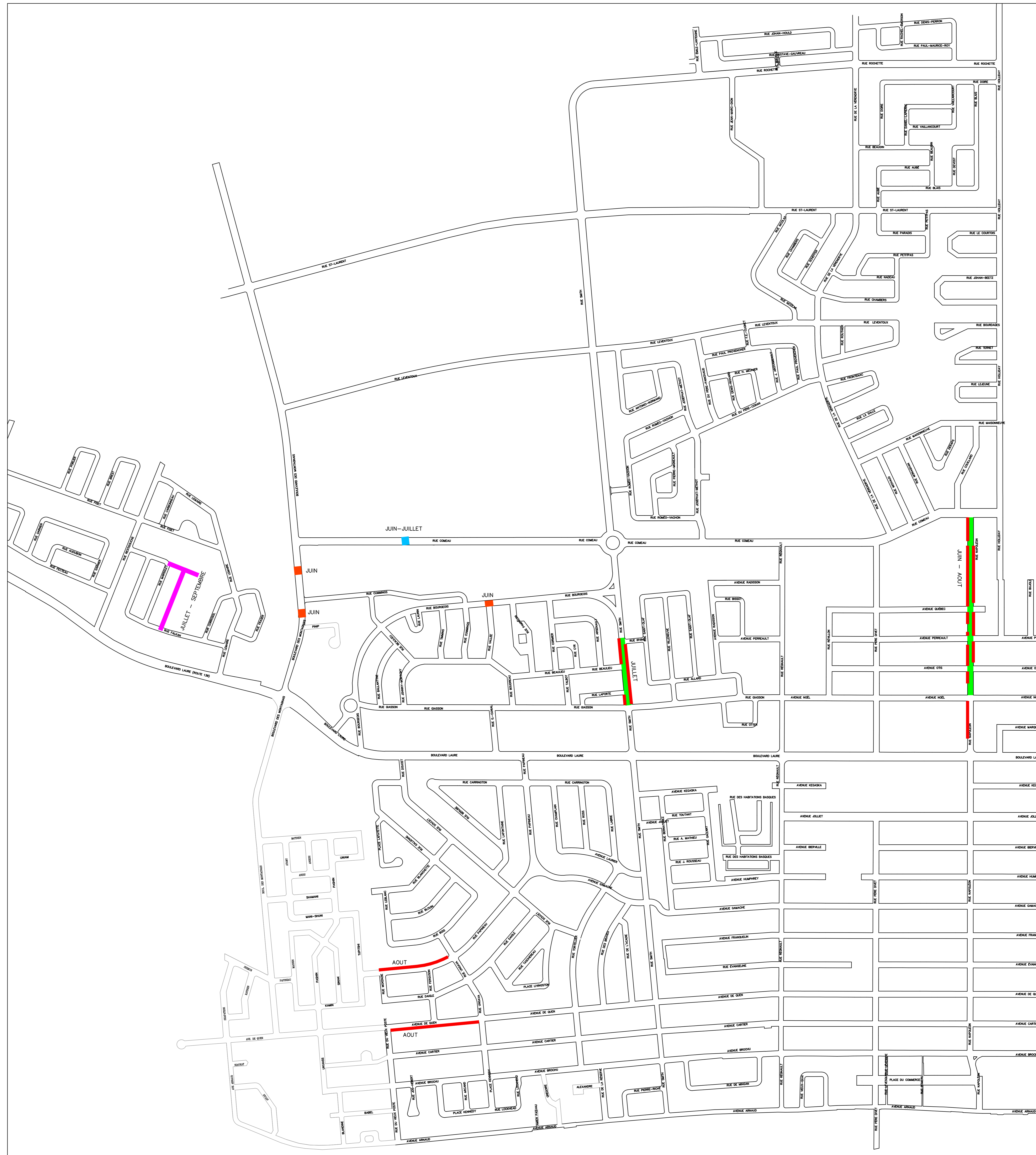
VILLE DE SEPT-ÎLES