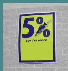
Enseigne promotionnelle au mur en « coroplast » (NON-CONFORME)