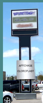
« Coroplast » sur poteau (NON-CONFORME)