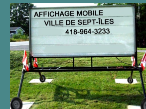
Enseigne sur remorque