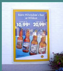
Enseigne promotionnelle au mur dans un boîtier entouré d'un cadre rigide (CONFORME)