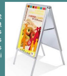
Enseigne sur chevalet